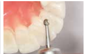
12 Carbide finishing