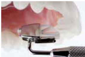
5+6 For further bite ramps please pay attention to the lateral auxiliary line