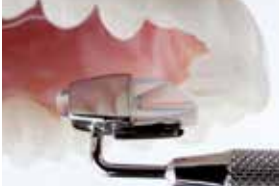
5+6 Bei weiteren Aufbissen seitliche Hilfslinie beachten.