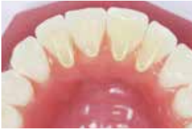
10 Mehrere Aufbisse ergeben ein Aufbissplateau.