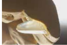
9 Anatomically perfect position of bite ramp