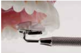
4 Pull off and remove excess resin with scaler