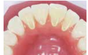
10 Several bite ramps form a bite plate