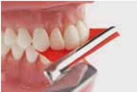
7+8 Abschließend Höhenkontrolle mit Kontaktfolie. Vorkontakte mit Diamantsteinchen entfernen.