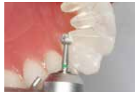
11 Diamond burr