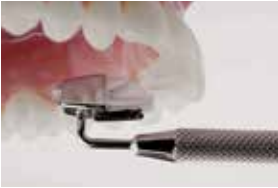
4 Abziehen und Überstände mit Scaler entfernen