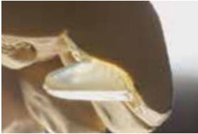
9 Anatomisch perfekter Sitz der Aufbisse.