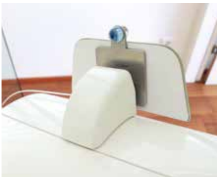
1 Mittige Positionierung (Montageschablone für Sirona LEDview), die beiden Positionierungsstifte verschwinden in der Leuchtenut