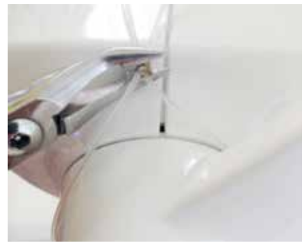
3 Sichern des Silchs durch das Klemmen der Öse